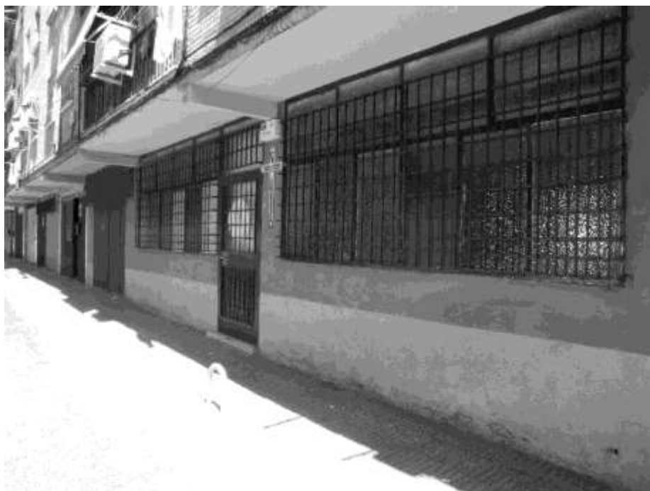
Figura 23. Exterior de la parroquia que la Iglesia Ortodoxa Rumana tiene en Getafe. Se encuentra junto a una parroquia Católica Romana

Por lo tanto, desde la perspectiva de los responsables de la Iglesia Ortodoxa Rumana en España, se están siguiendo los pasos adecuados para solventar los diferentes retos que se presentan ante ellos, pero esta solución pasa, de forma unívoca, por la firma de un Acuerdo de Cooperación con el Estado español y es en este punto en el que se encuentran con la falta de sintonía por parte de los diferentes representantes políticos del Estado. Se valora positivamente, en cambio, la actitud de los gobiernos de la Generalitat de Cataluña que, allí donde tienen asumidas las competencias, incluyen a las iglesias ortodoxas en las normas reguladoras.