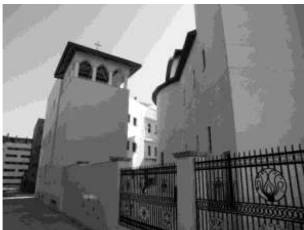
Figura 20. Exterior de la catedral de la Iglesia Ortodoxa Rumana de Madrid. Zona del edificio destinada a los servicios y la administración

dido por la Iglesia Católica Romana. En 2010, el Patriarca Daniel de la Iglesia Ortodoxa Rumana coloca la primera piedra en una ceremonia en la que se bendijeron las obras. Éstas transcurrirán con numerosos retrasos y, de hecho, todavía en 2020 el edificio está a la espera de múltiples remates, ya que la primera fase comenzó dos años después de poner la primera piedra, en 2012, construyéndose el sótano en dos niveles. El primero de estos niveles está destinado a la creación de una escuela rumana y a una sala de reuniones, así como a una biblioteca. El segundo será de servicio ya que albergará el garaje y las instalaciones de maquinaria.