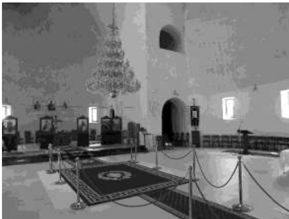
Figura 21. Interior de la catedral Ortodoxa Rumana de Madrid. La alfombra oculta la zona donde se incrustará un mosaico que representa el águila bicéfala (foto de Roberto Rodríguez)

Figura 22. Interior de la catedral de la Iglesia Ortodoxa Rumana de Madrid. Se observa que aún no han sido colocados los revestimientos de las paredes (foto de Roberto Rodríguez)